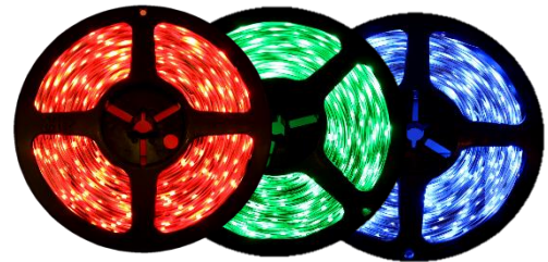
Red Green Blue Available in NB & SB Only NB, SB & UB Only