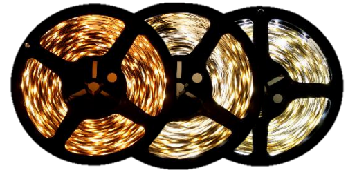
Warm White 3000K Pure White 4200K Cool White 6000K

Inspired LED Flexible Strip Lights are a simple, customizable solution for all of your LED lighting needs. These unique strips can be cut to length and terminated with solderless end connectors for easy DIY installation. Energy efficient, with a wide range of options for brightness and color, LED Flex Strips are the perfect option for any lighting application.