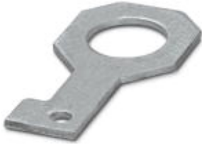
Plate for fixing the FLT-ISG-100-EX isolating spark gap to a flange, drill hole diameter of 42 mm.

Please be informed that the data shown in this PDF Document is generated from our Online Catalog. Please find the complete data in the user's documentation. Our General Terms of Use for Downloads are valid ( http://phoenixcontact.com/download )