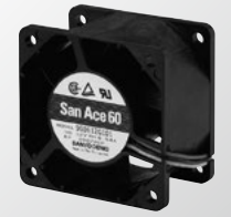
(Ribless model depicted)