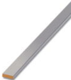
PEN conductor busbar, 3x10 mm, length: 2000 mm

Please be informed that the data shown in this PDF Document is generated from our Online Catalog. Please find the complete data in the user's documentation. Our General Terms of Use for Downloads are valid ( http://download.phoenixcontact.com )