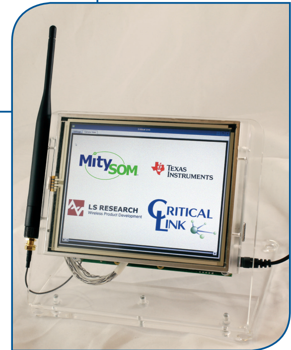
Development Kit with Display