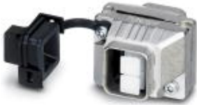
SCRJ push-pull coupling

SCRJ push-pull coupling, IP67, metal, with protective cover, color: nickel-plated