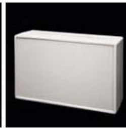
The entire front can be used for mounting keypads, switches, displays etc.