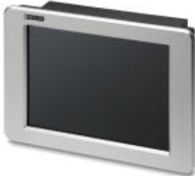
15-in. display shown

Please be informed that the data shown in this PDF Document is generated from our Online Catalog. Please find the complete data in the user's documentation. Our General Terms of Use for Downloads are valid ( http://download.phoenixcontact.com )