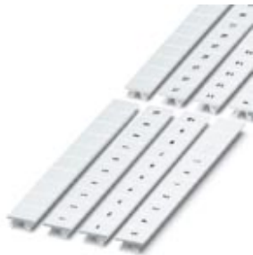
Zack marker strip, 10-section, horizontally labeled with the identical number: 71, white

Please be informed that the data shown in this PDF Document is generated from our Online Catalog. Please find the complete data in the user's documentation. Our General Terms of Use for Downloads are valid ( http://phoenixcontact.com/download )