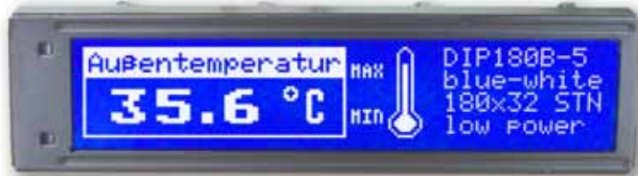
EA DIP180B-5NLW Dimension 102 x 27 mm