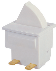
H3145AA - - -