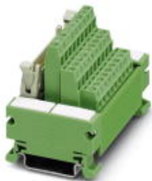
VARIOFACE module, with screw connection and flat-ribbon cable connector, for assembly on NS 35/7.5, 26 positions

Please be informed that the data shown in this PDF Document is generated from our Online Catalog. Please find the complete data in the user's documentation. Our General Terms of Use for Downloads are valid ( http://phoenixcontact.com/download )