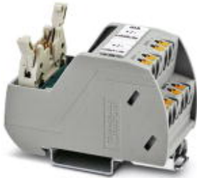
VARIOFACE Professional (VIP) board for the ROC800 controller

Please be informed that the data shown in this PDF Document is generated from our Online Catalog. Please find the complete data in the user's documentation. Our General Terms of Use for Downloads are valid ( http://phoenixcontact.com/download )