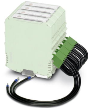
Figure shows variant for 4 modules

http://eshop.phoenixcontact.de/phoenix/treeViewClick.do?UID=2900752