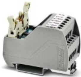
VARIOfACE Professional (VIP) board for the ROC800 controller

Please be informed that the data shown in this PDF Document is generated from our Online Catalog. Please find the complete data in the user's documentation. Our General Terms of Use for Downloads are valid ( http://phoenixcontact.com/download )