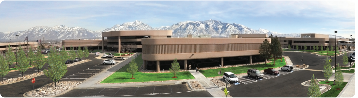
Merit Sensor is based in Salt Lake City, Utah