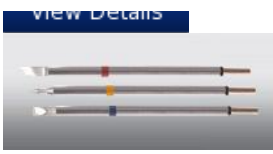
Replacement Soldering Tips P Series