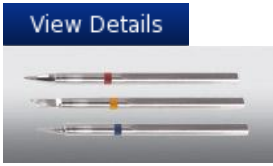
Replacement Soldering Tips S Series