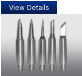
Replacement Soldering Tips H Series