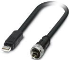
Assembled USB cable, shielded, color: black, PVC outer sheath, USB mini-B/IP20 on USB type A/IP20, length: 1 m

Please be informed that the data shown in this PDF Document is generated from our Online Catalog. Please find the complete data in the user's documentation. Our General Terms of Use for Downloads are valid ( http://download.phoenixcontact.com )