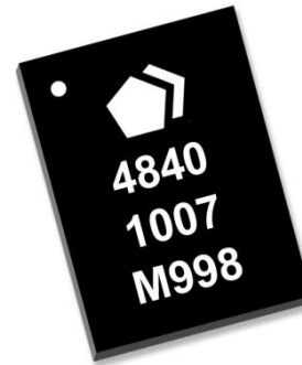
14-pin 3X4 QFN