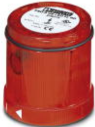
LED flashing beacon element, 24 V DC, double flash, red

Please be informed that the data shown in this PDF Document is generated from our Online Catalog. Please find the complete data in the user's documentation. Our General Terms of Use for Downloads are valid ( http://phoenixcontact.com/download )