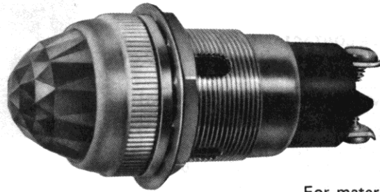
103-3502-1331-403 Torpedo Faceted lens

For materials and finishes of products in this group, see preceding page.