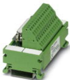
VARIOFACE module, with spring-cage connection and D-Subminiature socket strip, for mounting on NS 35/7.5, 25-pos.

Please be informed that the data shown in this PDF Document is generated from our Online Catalog. Please find the complete data in the user's documentation. Our General Terms of Use for Downloads are valid ( http://phoenixcontact.com/download )