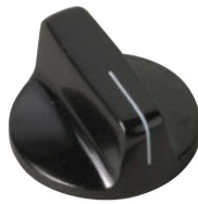
5500E, 5520E, 5521E