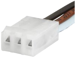
Wire Harness Wire harness for SCHURTER products