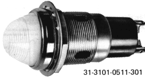
31-3101-0511-301 Torpedo lens