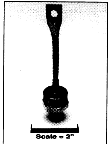
IN3288A, AR - IN3297A, AR General Purpose Rectifier 100 Amperes Average, 1400 Volts