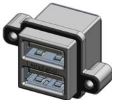
MUSB-C111-30 TYPE A, STACKED, RIGHT ANGLE