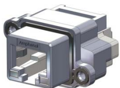
MRJR-538X-01 SHOWN RIGHT ANGLE, PCB TAIL, 8 POSITION RJ45