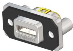
MUSB-K152-30 SERIES MICRO-AB RIGHT ANGLE, PCB TAIL