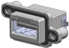
MUSBR-A511-40 TYPE A, VERTICAL, LOW PROFILE