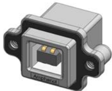
MUSB-D111-30 TYPE B, RIGHT ANGLE