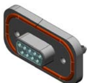
9 POSITION CONNECTOR SHOWN