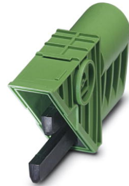
Illustration shows the article plugged-in on a Ruggedline bus connection plug

http://eshop.phoenixcontact.de/phoenix/treeViewClick.do?UID=2819969