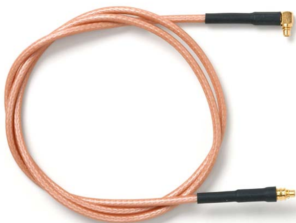
Model 73064 MMCX Plug to Right-Angle MMCX Plug, RG316/U

Snap-on coupling and micro-miniature size for fast connect and disconnect where space is limited