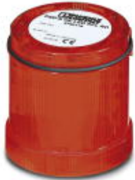
LED random flashing beacon element, 24 V DC, red

Please be informed that the data shown in this PDF Document is generated from our Online Catalog. Please find the complete data in the user's documentation. Our General Terms of Use for Downloads are valid ( http://phoenixcontact.com/download )