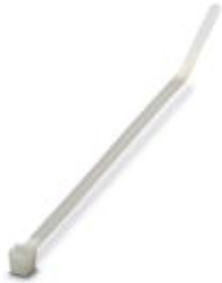
Cable tie, dimensions: L x W, 290 x 4.8 mm, color: transparent

Please be informed that the data shown in this PDF Document is generated from our Online Catalog. Please find the complete data in the user's documentation. Our General Terms of Use for Downloads are valid ( http://download.phoenixcontact.com )