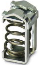
Shield connection terminal block, for applying the shield to busbars

Please be informed that the data shown in this PDF Document is generated from our Online Catalog. Please find the complete data in the user's documentation. Our General Terms of Use for Downloads are valid ( http://download.phoenixcontact.com )