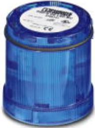
LED permanent light element, 24 V AC/DC, blue

Please be informed that the data shown in this PDF Document is generated from our Online Catalog. Please find the complete data in the user's documentation. Our General Terms of Use for Downloads are valid ( http://phoenixcontact.com/download )