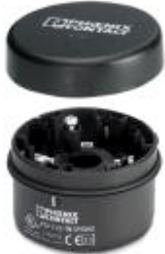
Connection element with spring-cage terminal blocks for tube mounting

Please be informed that the data shown in this PDF Document is generated from our Online Catalog. Please find the complete data in the user's documentation. Our General Terms of Use for Downloads are valid ( http://phoenixcontact.com/download )