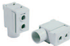
Type/Cat. No: P50UB Description: Modular Direct Power Feed