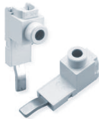
Type/Cat. No: P50UT Description: Power Feed Lug