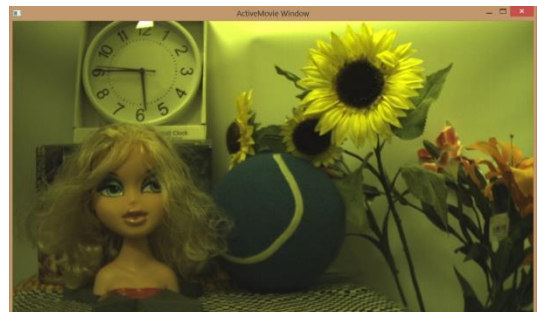
Camera Tool view mode