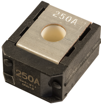
ZCASE Single Mega/Starter Fuse