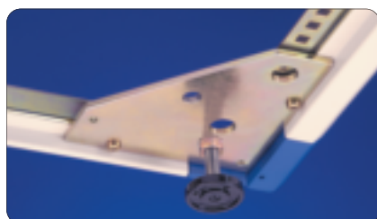
Universal corner bracket with jacking foot standard with frame type 'A' & 'B'

Each Caster Kit includes four (4) locking casters and hardware.