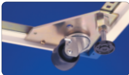
Caster installed with jacking foot