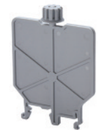
Mounting Accessories for CTSPC