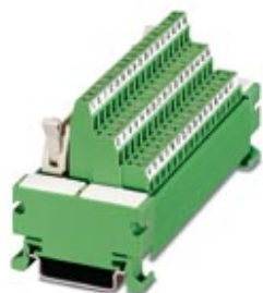
VARIOFACE module, with screw connection and flat-ribbon cable connector, for assembly on NS 35/7.5, 64 positions

Please be informed that the data shown in this PDF Document is generated from our Online Catalog. Please find the complete data in the user's documentation. Our General Terms of Use for Downloads are valid ( http://phoenixcontact.com/download )