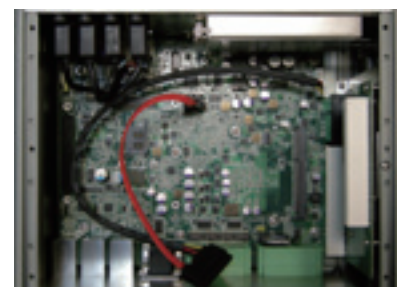
» Fanless Design

All specifications are subject to change without notice.