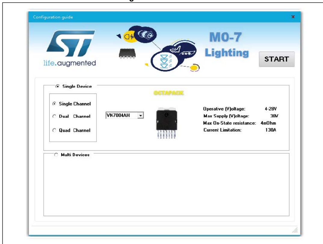
Figure 2. Gui interface

GUI is available to control the entire system, that is to say SPC560B-DIS Discovery board connected with the VIP-M07-ADIS application board. For more information, and download of the latest version available, please refer to ST web www.st.com .