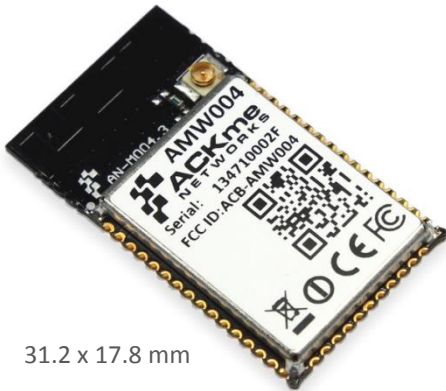
31.2 x 17.8 mm