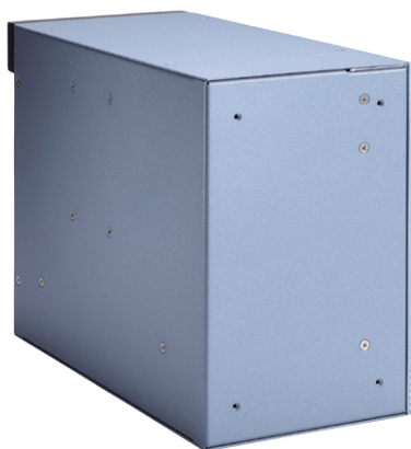
▲ Rear view