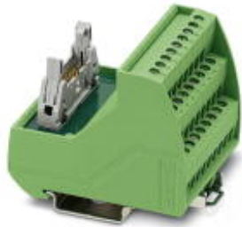
VARIOFACE sensor module, for connecting 8 pnp sensors

Please be informed that the data shown in this PDF Document is generated from our Online Catalog. Please find the complete data in the user's documentation. Our General Terms of Use for Downloads are valid ( http://phoenixcontact.com/download )