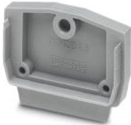
End cover, Length: 32 mm, Width: 4 mm

Please be informed that the data shown in this PDF Document is generated from our Online Catalog. Please find the complete data in the user's documentation. Our General Terms of Use for Downloads are valid ( http://phoenixcontact.com/download )