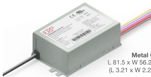
Metal Case L 81.5 x W 56.2 x H 31.5 mm (L 3.21 x W 2.21 x H 1.24 in)