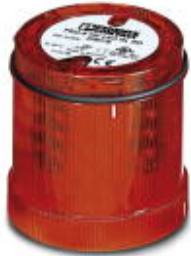
LED rotating light element, 24 V AC/DC, red

Please be informed that the data shown in this PDF Document is generated from our Online Catalog. Please find the complete data in the user's documentation. Our General Terms of Use for Downloads are valid ( http://phoenixcontact.com/download )