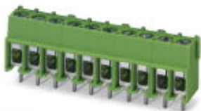
The figure shows a 10-position version of the product

PCB terminal block, nominal current: 32 A, nom. voltage: 400 V, pitch: 5 mm, number of positions: 6, connection method: Screw connection with wire protector, mounting: Wave soldering, conductor/PCB connection direction: 0 °, color: green