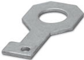
Plate for fixing the FLT-ISG-100-EX isolating spark gap to a flange, drill hole diameter of 36 mm.

Please be informed that the data shown in this PDF Document is generated from our Online Catalog. Please find the complete data in the user's documentation. Our General Terms of Use for Downloads are valid ( http://phoenixcontact.com/download )